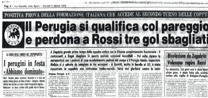
Gazzetta dello Sport del 04.10.1979