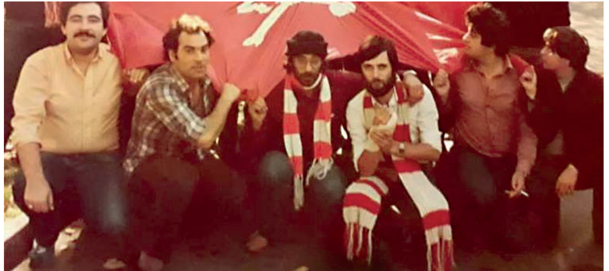
Un gruppo di ultras a Zagabria.